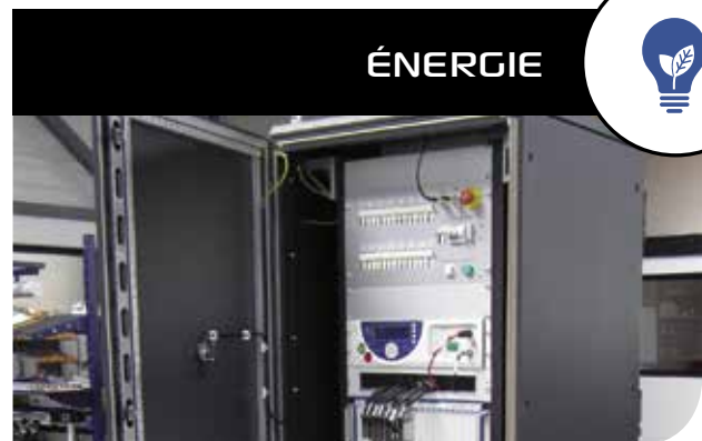
BANC DE TEST STATION D'ESSAI CRYOGÉNIQUE