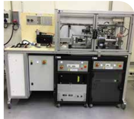
BANC CALCULATEUR ASSISTANCE FREINAGE

DBA propose des solutions de test sur l'ensemble du cycle de vie du produit.