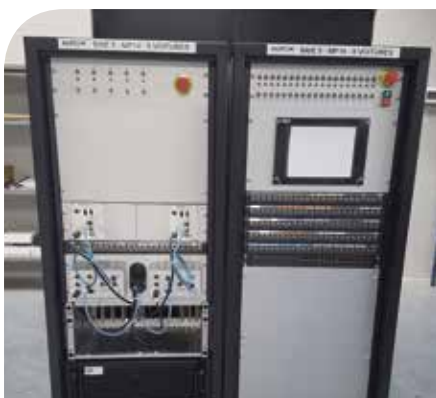
BANC MATÉRIEL ROULANT MÉTRO

Au cours de la vie série du produit : bancs d'expertise.