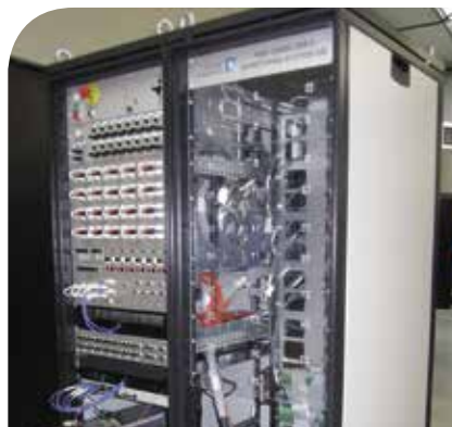
BANC SYSTÈME VIDEO AIRBUS A380

DBA propose aux équipementiers aéronautiques des solutions dédiées au test d'un calculateur seul ou d'un système complet (exemple : jaugeage carburant), des interfaces de tests compactes et des bancs certifiés conformes aux normes électriques et CEM si nécessaire.