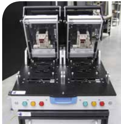
BANC TEST CARTES ÉLECTRONIQUES

Dans l'univers médical, DBA réalise, par exemple, des moyens de tests pour des appareils embarqués permettant de traiter les pathologies cardiaques, comme les pacemakers ou défibrillateurs.