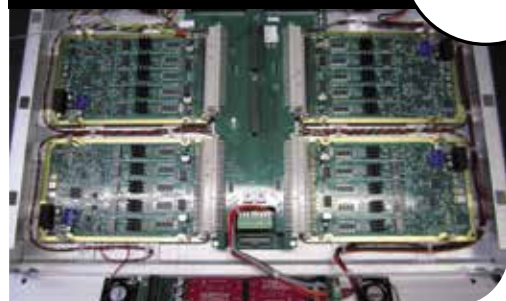
TIROIR DSO (DISCRET SIGNAL OUTPUT)