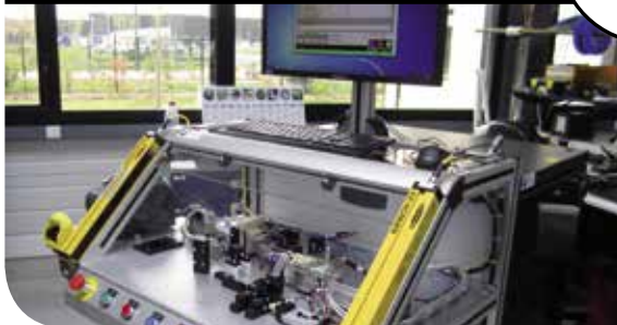
TESTEUR FONCTIONNEL POUR CAPTEUR ACCÈS MAINS LIBRES VÉHICULE