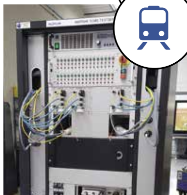
SIMULATEUR SYSTÈME TRAIN À GRANDE VITESSE