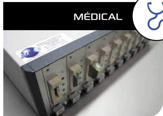
BANC FONCTIONNEL PACEMAKER