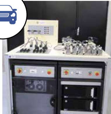
BANC SYSTÈME ADAS